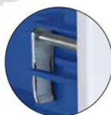
Detalle del agarre