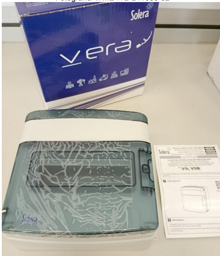
Fotografía 5: ME-ITE-241066-02