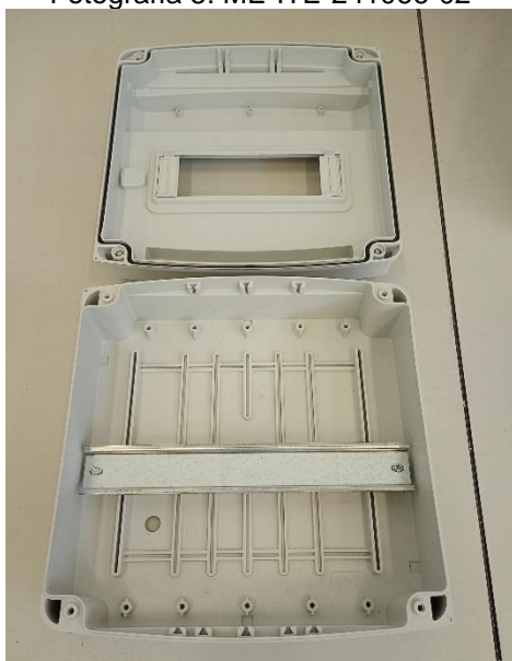
Fotografía 6: ME-ITE-241066-02, embalaje